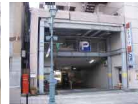
駐車場入口(1F 2.6m、B1F 2.0m)