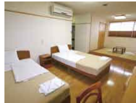
ファミリーツイン(4名まで宿泊可)