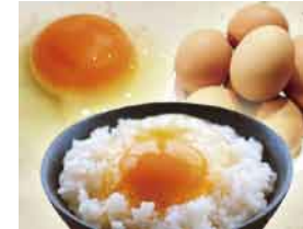
地産地消「卵かけごはん」(有料)