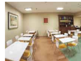
ラウンジ/ご朝食会場(1F)