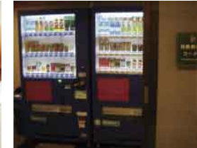
自動販売機コーナー(5F・7F)