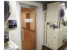
コインランドリー(7F)