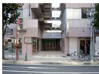
山形銀行本店側入口(尚美堂が目印)